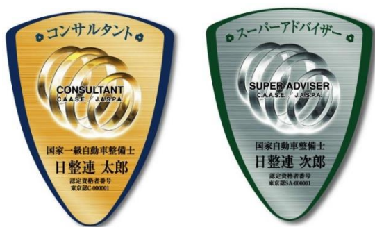
認 定 バ ッ ジ